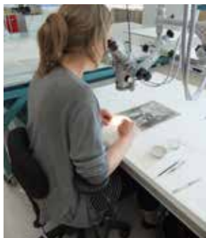
Restauration d'œuvres d'art Laboratoire d'archéologie du Qc

Le système d'appuis-coudes mobiles Posiflex aide à prévenir et diminuer les troubles musculosquelettiques.