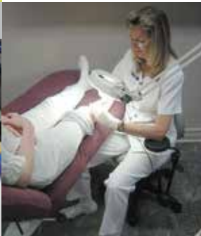
Électrolyse Profil de Soie, Qc