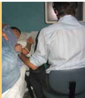
Échographie cardiaque Hôpital Hôtel-Dieu de Lévis

Le système d'appuis-coudes mobiles Posiflex aide à prévenir et diminuer les troubles musculosquelettiques.