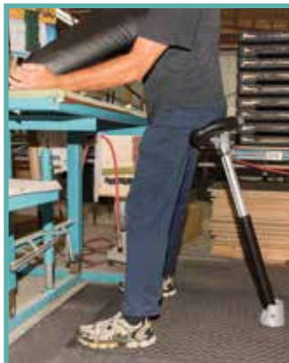
Poste de rembourrage multi tâches.

Le banc mobile Posiflex est conçu pour améliorer le confort et préserver l'aisance de mouvements pour les travailleurs qui occupent un poste quasi stationnaire debout.